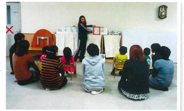
グループ保育：お集まり活動の様子